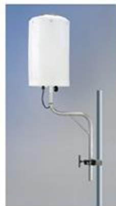
ガイドポール仕様 (重機搭載)