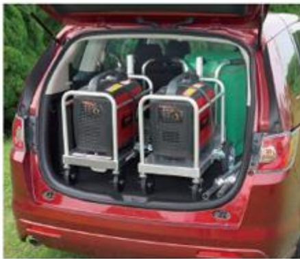
ライトバンにも軽々積み込めます。