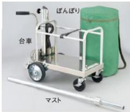
組み立て、収納もラクラク。