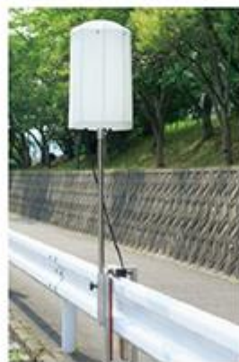
ガードレール仕様