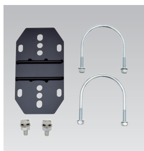
LMF-P75 (パイプ用固定金具)