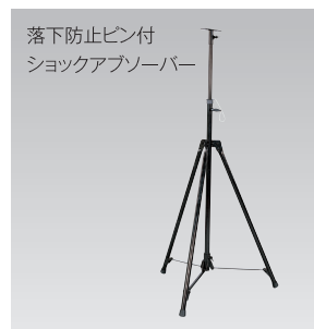
S-01 (スタンダード三脚)

JANコード/4937305-03800-0 梱包数/4 元払発送単位/4 標準価格(税別) 8,000円