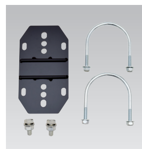
LMF-P90 (パイプ用固定金具)