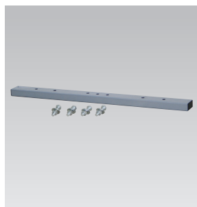
F-01 (2灯用フラットバー)

※灯具は付属しておりません。 梱包数/— 元払発送単位/50 標準価格(税別) 1,500円