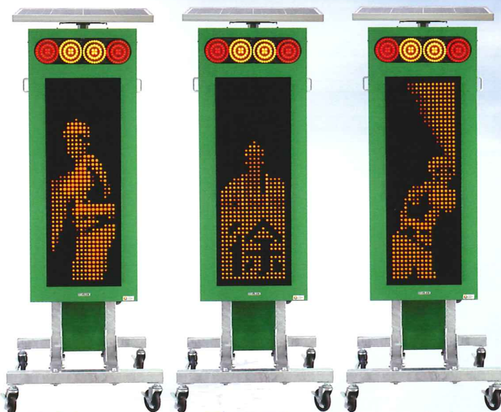
「旗振り」 「徐行」 「右(左)寄せ」