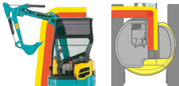
■ 自動回避領域 ■ 干渉防止領域

バケットが運転室に衝突しないよう、干渉領域に入る前に、ブームが止まることなく滑らかに運転室を回避。従来のようにブームが止まり、再作動時にはブームを干渉領域外まで戻す必要がなく、ノンストップで作業が続行できます。オペレータはストレスを感じることなく、作業効率もアップします。